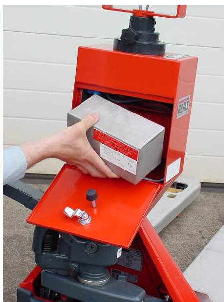
Baterie výměnná v EX zóně